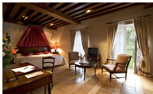
Chambre Grand Confort