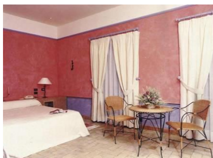
Chambre 1er étage